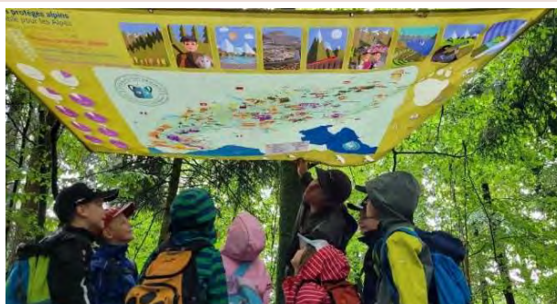
I giovani in vetta 2023