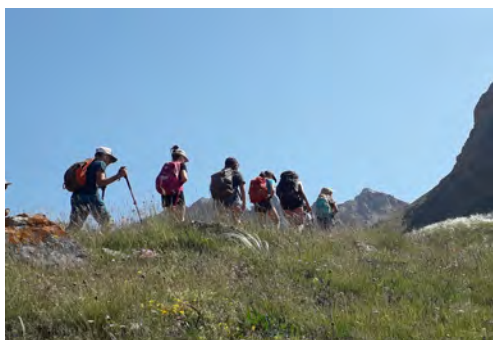
I giovani in vetta 2023