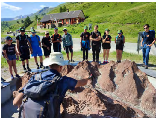
I giovani in vetta 2023