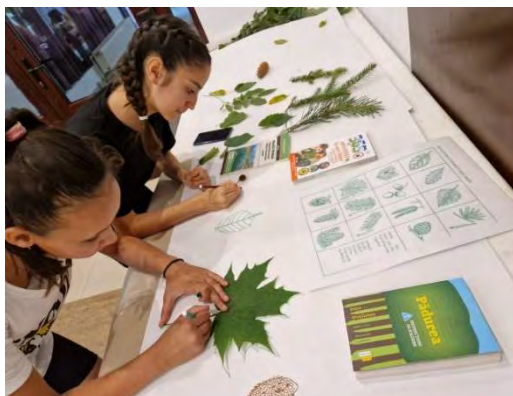
I giovani in vetta 2023

Tutti i partner sono invitati a utilizzare questi social network per comunicare con i giovani.