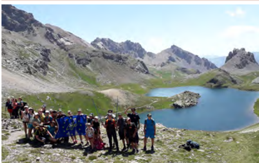
I giovani in vetta 2023

Inoltre, lo strumento educativo "The Alps in my backpack" sarà aggiornato per il 10° anniversario dei giovani in vetta 2024. La versione rinnovata dello strumento non solo avrà un nuovo design, ma tratterà anche temi attuali come il cambiamento climatico, la produzione di energia rinnovabile nelle Alpi e le zone umide alpine. La nuova versione sarà messa a disposizione di tutti gli organizzatori per essere utilizzata per le attività programmate.