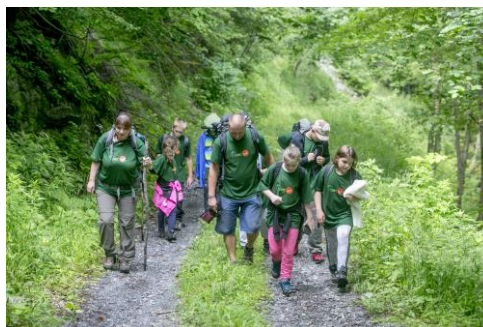
Youth at the Top 2017 ©Mala Fatra National Park_Jurik - Slovakia