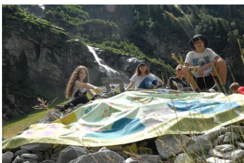
Youth at the Top 2017 Nationalpark Hohe Tauern Kärnten