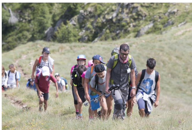
Youth at the Top 2017

Sono possibili partnership tecniche con altre reti od organizzazioni che operano a livello nazionale/regionale in altri paesi alpini. ALPARC è aperta a nuove collaborazioni con i vari paesi alpini.